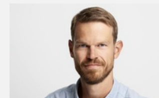
Svend Brinkmann Genbeskikket 15/02/2025